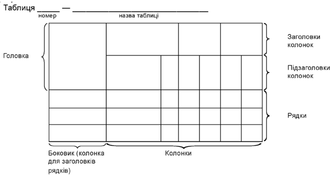
Рис.1 – Оформлення таблиць