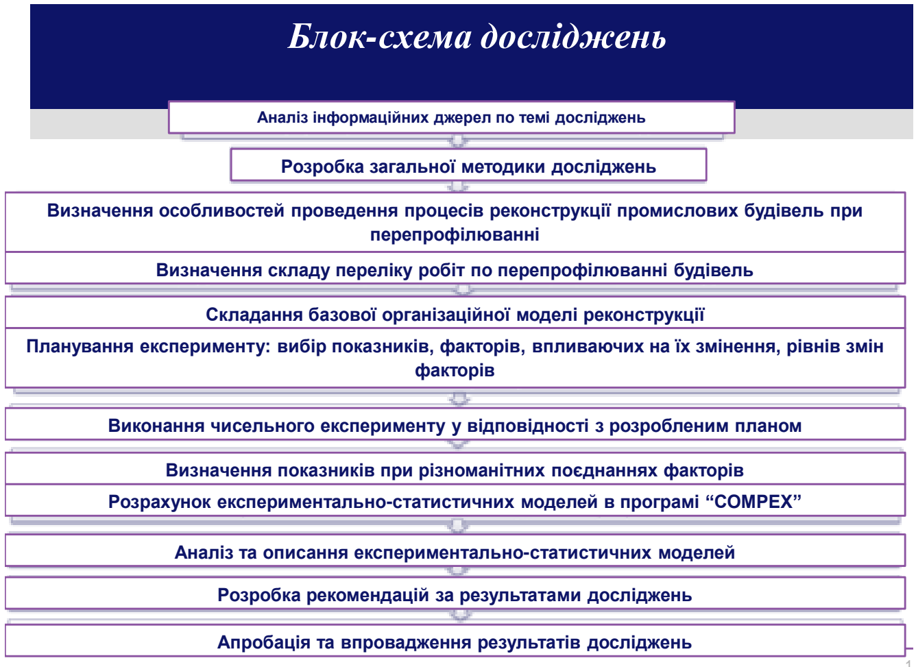
Рис.Д1 – Приклад блок-схеми досліджень на основі чисельного експерименту