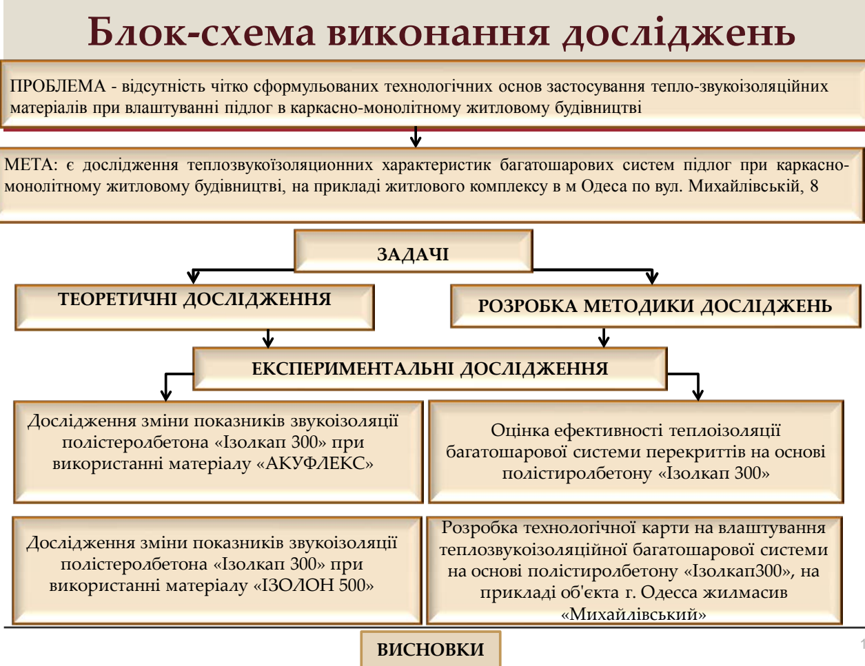
Рис.Д3 – Приклад блок-схеми досліджень на основі натурального експерименту